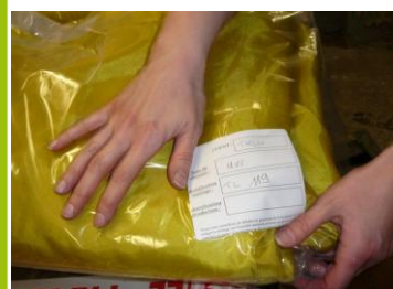
Emballage individuel avec repérage des tronçons