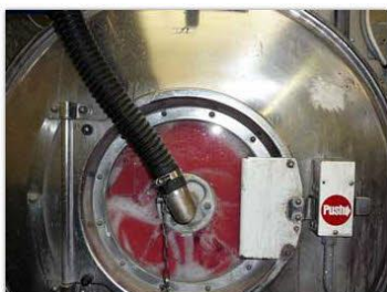
Phase de rinçage